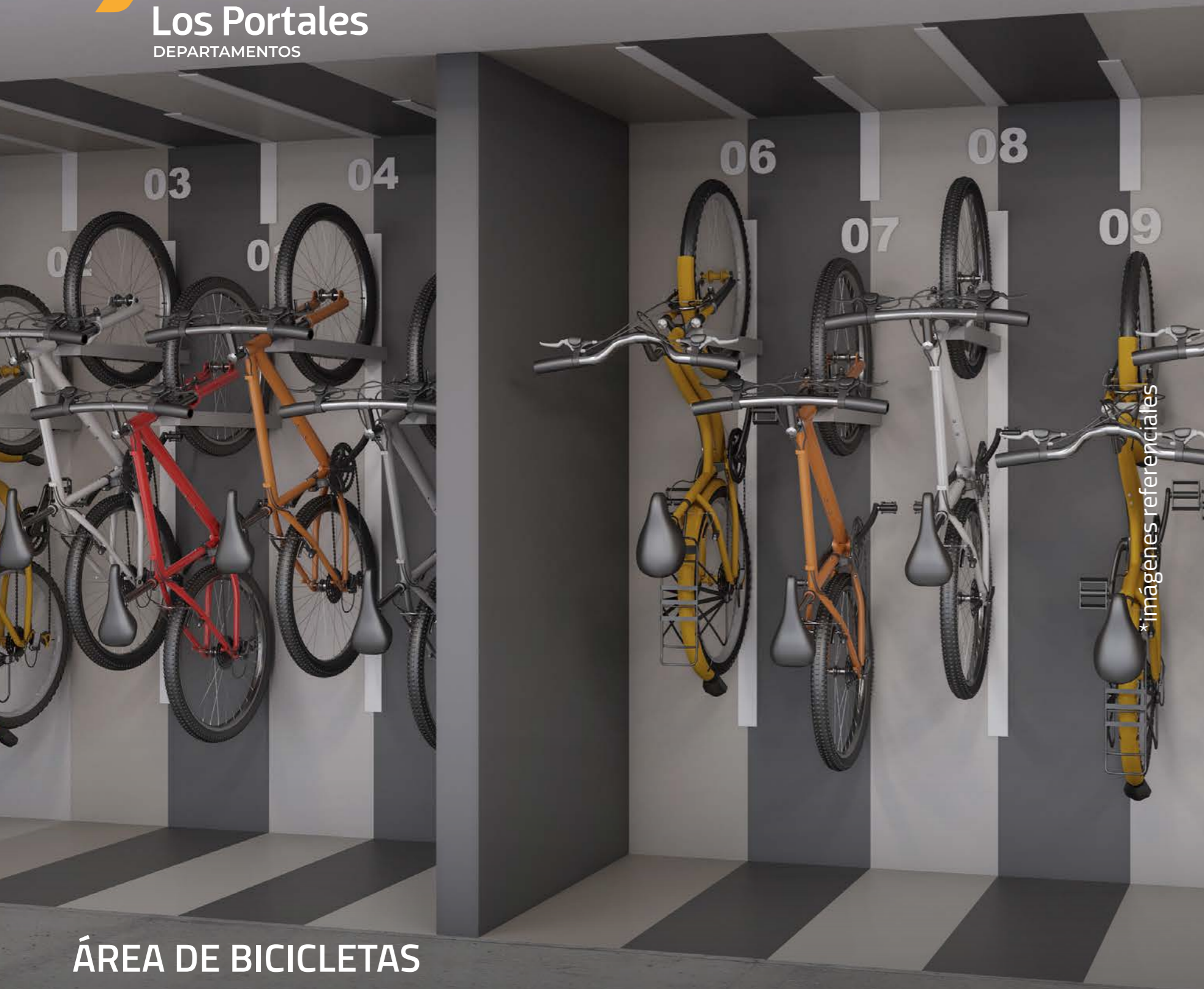
ÁREA DE BICICLETAS