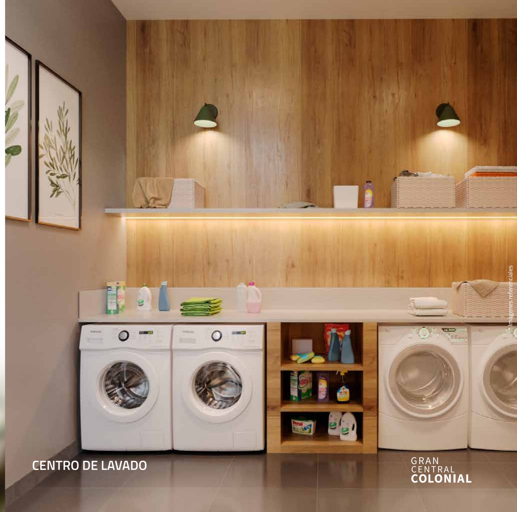
CENTRO DE LAVADO