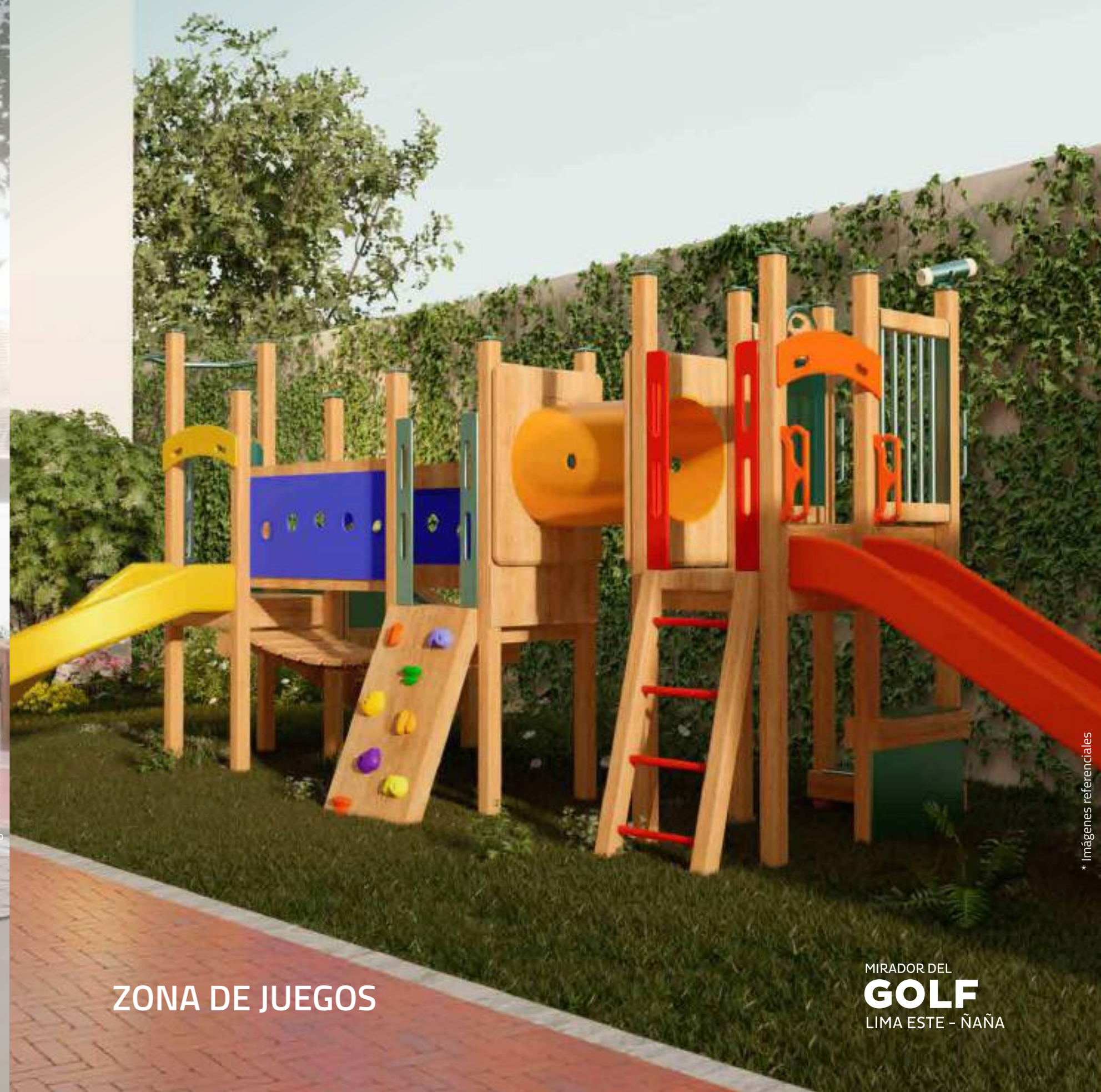
ZONA DE JUEGOS