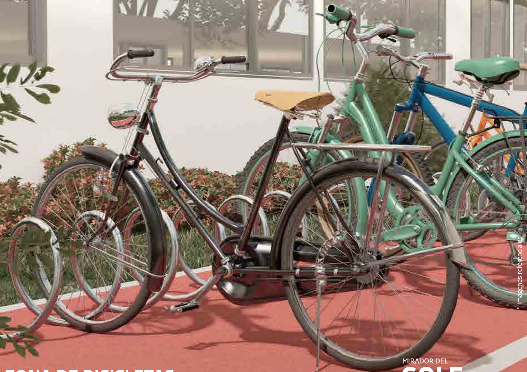
ZONA DE BICICLETAS